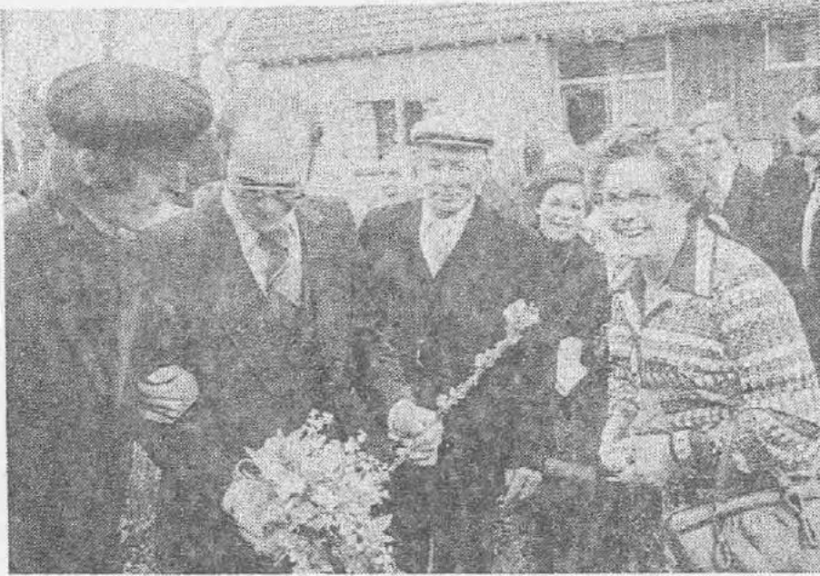
● De bruidegom krijgt van zijn moeder een versierde pijp. Links zijn „eiser”.